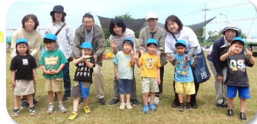
たんぽぽ組 おじいちゃん・おばあちゃん、いっぱい遊んで楽しかったね!!