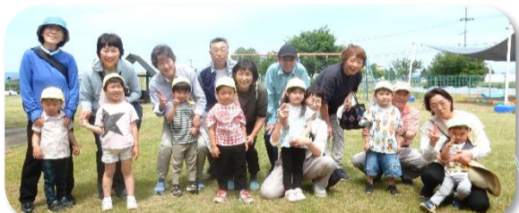
すみれ組 おじいちゃん・おばあちゃんとの初めての会！最初はドキドキ・最後はニコニコ😊