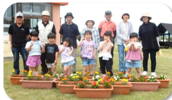
ひまわり組 ベゴニア&マリーゴールドと一緒に植えました！毎日の水やりを頑張ります!!